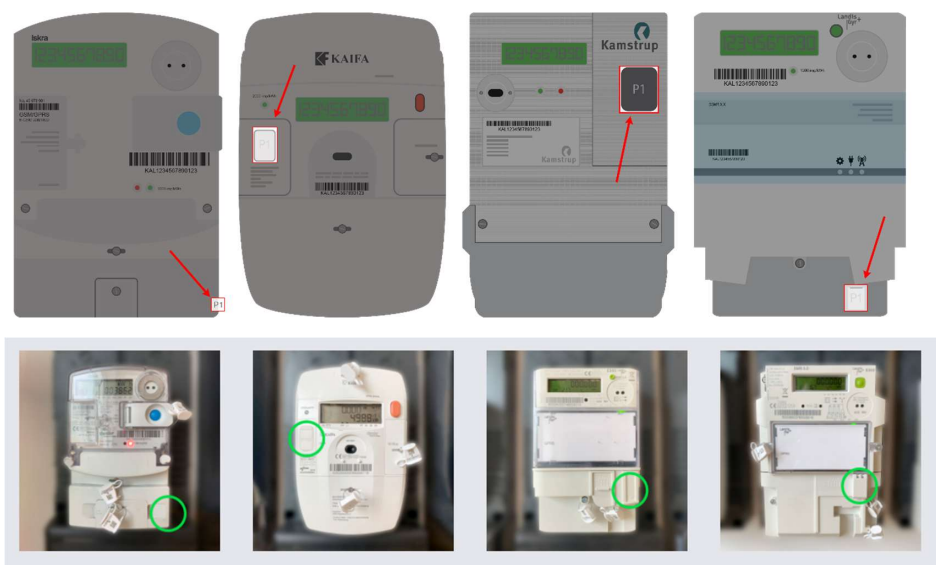
Mogelijke locaties P1 poort